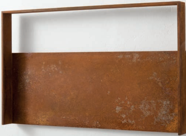
VOID V 2015 Stahl mit Rost-Patina 53,3 x 32,2 x 4,5 cm