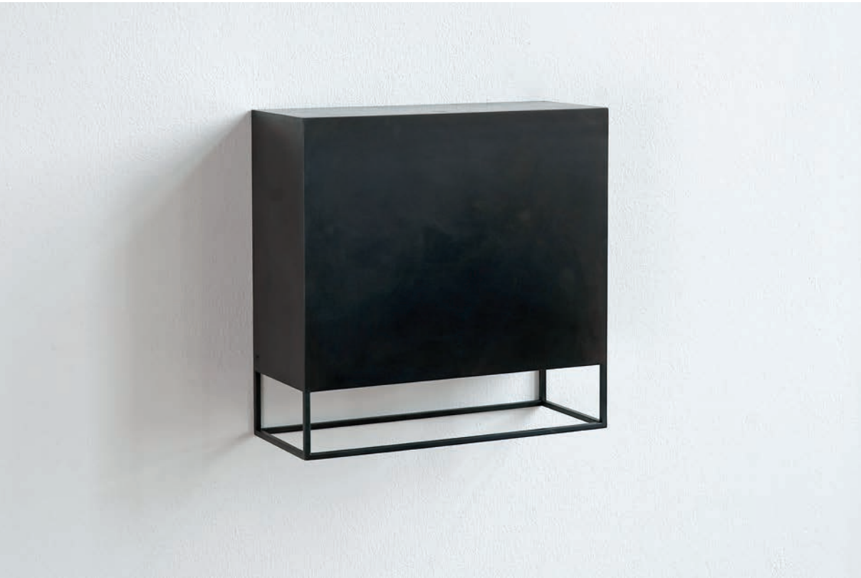
Resonance Shape-H 2009 Auflage 2/3 Gebrannter Stahl 32 x 32 x 13 cm