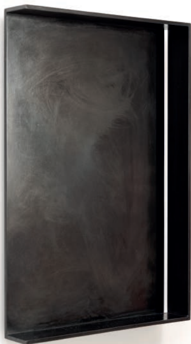
VOID XVIII 2016 Gebrannter Stahl 38,2 x 25,7 x 4,4 cm