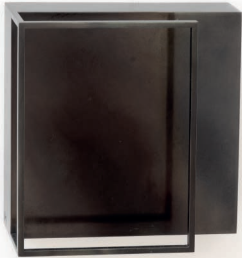
Resonance Shape -S 2016 Auflage 2/2 + 1 AP Gebrannter Stahl 22,5 x 22,5 x 9 cm