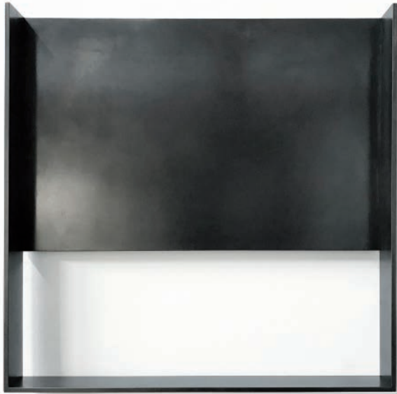
VOID XXIII 2018 Gebrannter Stahl 38,2 x 38,2 x 4,4 cm