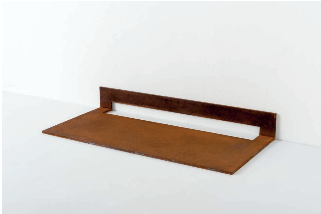
VOID IV 2015 Stahl mit Rost-Patina 53,3 x 25 x 6,7 cm